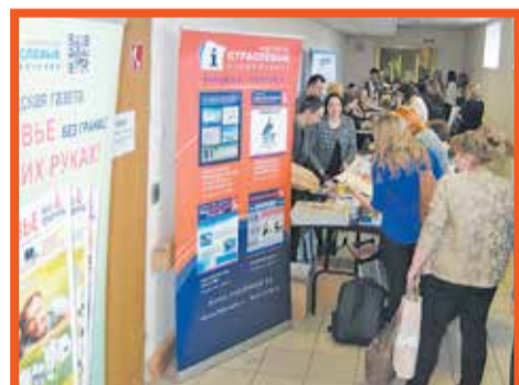
Международная научная конференция «Технологии реабилитации: наука и практика»