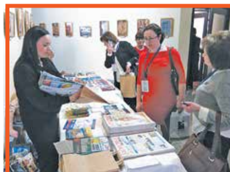
Научный форум по физической и реабилитационной медицине, санаторий «Белые ночи»