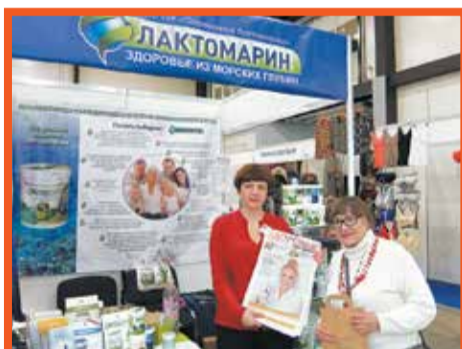
Международный форум «Старшее поколение»