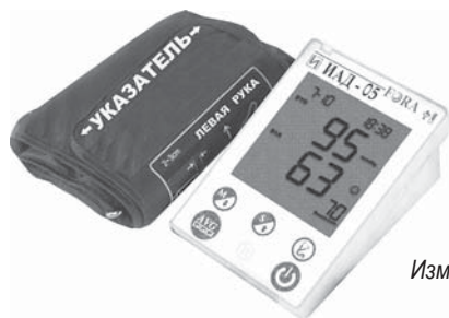
Измеритель артериального давления