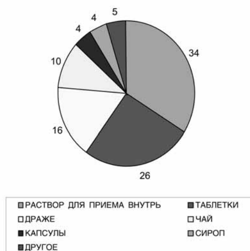
Рис. 2. Структура рынка БАД с успокаивающим действием по формам выпуска в 1-3 квартале 2006 г., %