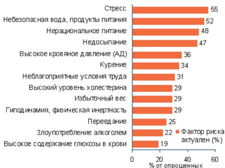
Оценка населением актуальности факторов риска, влияющих на здоровье

Кроме того, анализ региональных различий в актуальности рисков и стремлении придерживаться здорового образа жизни позволяет измерять